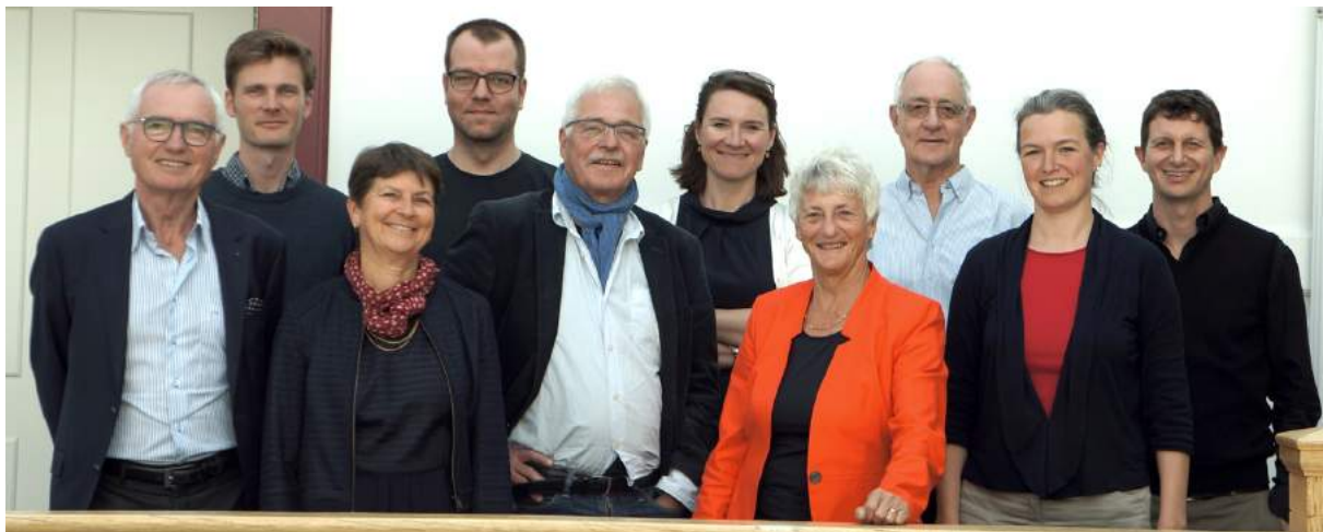
Stiftungsratssitzung Juni 2019