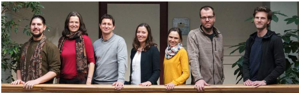
Team der Geschäftsstelle von sanu durabilitas Ende 2019